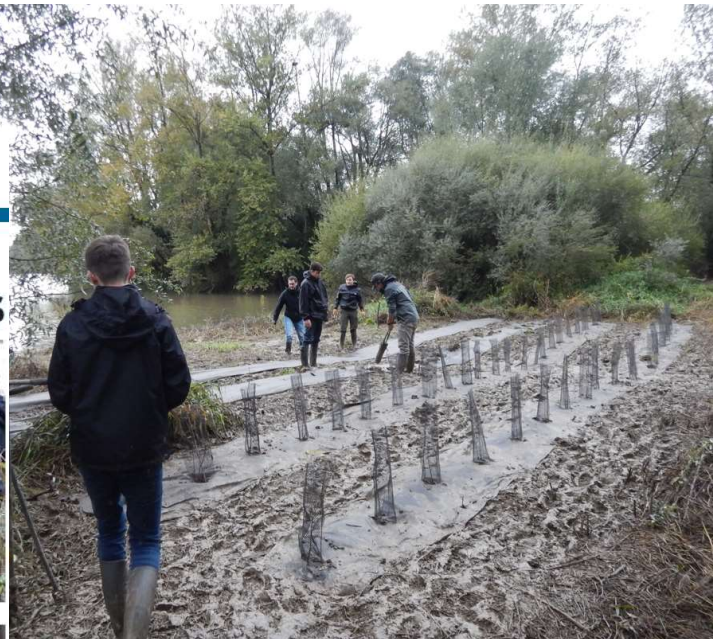
Avant et après plantations des boutures