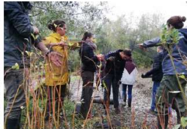
Il fallait être équipé de bottes, lundi après-midi, pour planter la centaine de saules.

Reste encore à planter dans le cadre d'un contrat Natura 2000. Il y a quelques mois, la Fédération de pêche de Gironde avait identifié le site macaire et son fort potentiel de fraie à brochet. La mission sera d'autres caractéristiques verticales. Parmi les actions de l'habitat du vigneron d'Europe, de la bourse, de la boiserie, de la grenouille verte, de l'argille et de la corde à corps fin, l'été