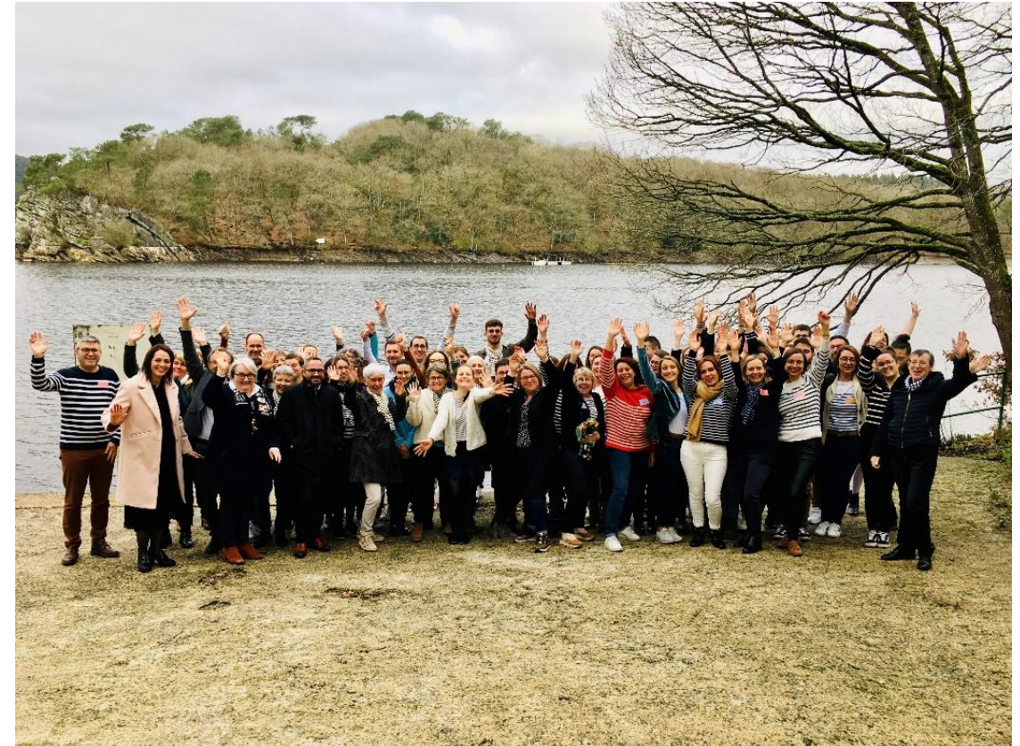
Les 70 acteurs du projet réunis à Guerlédan pour célébrer le lancement de DEN.bzh