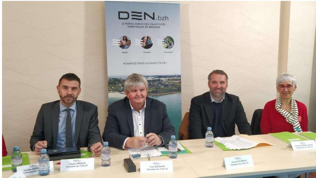
Conférence de presse en présence des quatre Centres de Gestion bretons