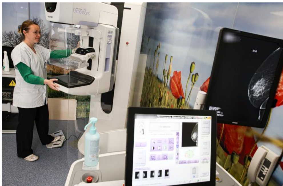
Un mammographe est embarqué à bord du camion "M ta santé".

Six médecins, une vingtaine d'infirmiers, quatre pharmaciens, trois diététiciens, deux psychologues, un manipulateur en radiologie, une sage-femme, un psychomotricien,