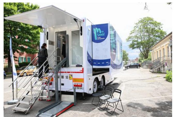
Trente mille personnes n'ont pas de médecin traitant dans l'agglomération mulhousienne.