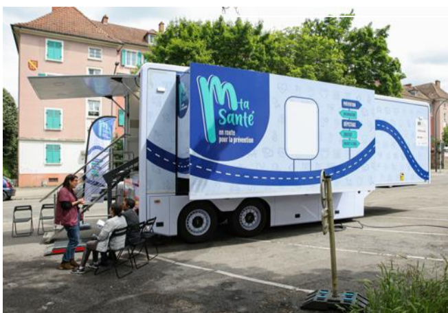
Le camion "M ta santé" stationné devant les immeubles du quartier Drouot, à Mulhouse.

C'est, en euros, le coût de l'investissement pour l'achat, l'équipement et l'agencement de l'unité mobile de dépistage et de prévention "M ta santé", financés par la région Grand Est, la Collectivité européenne d'Alsace, l'agence régionale de santé, l'Assurance maladie du Haut-Rhin, le Régime local d'Alsace Moselle, la préfecture. Le coût de fonctionnement annuel de l'unité s'élève, quant à lui, à 277 000 €.