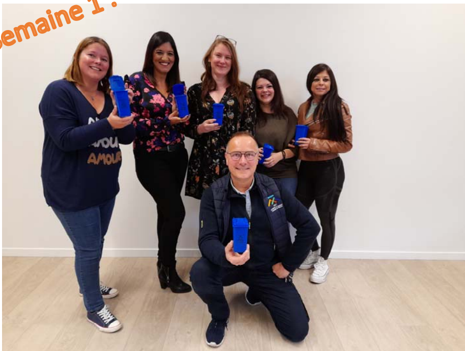
Direction des Affaires Générales