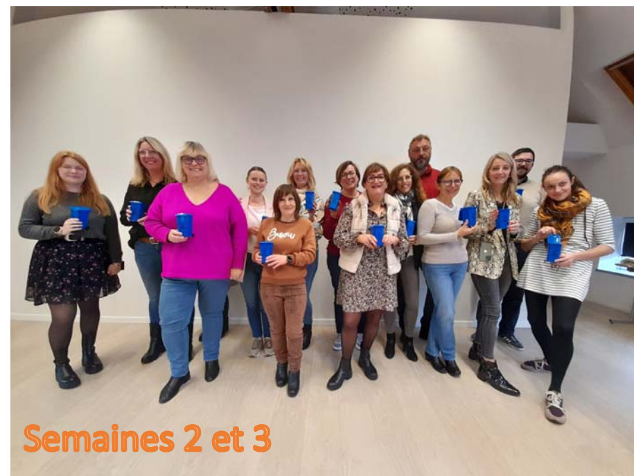
Semaines 2 et 3