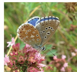
Azuré bleu-céleste Mais aussi : le Thècle de la ronce