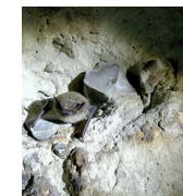
Murin à moustaches