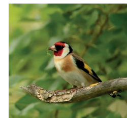
Chardonneret élégant Mais aussi : le Verdier d'Europe