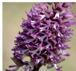
Orchis singe (avril-mai) Mais aussi : l'Ophrys araignée