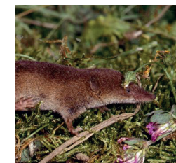
Musaraigne couronnée Mais aussi : le Campagnol agreste