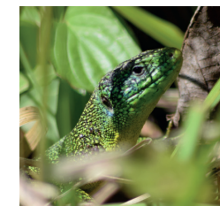
Lézard vert Mais aussi : l'Orvet fragile