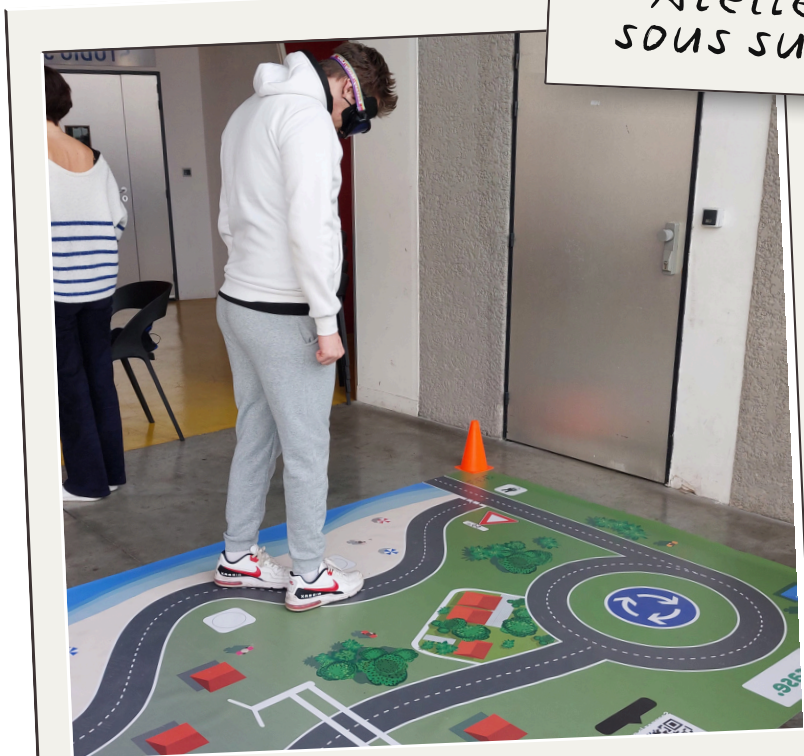
Parcours avec lunettes de simulation