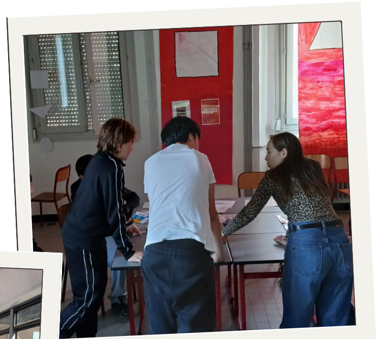
Atelier Destination finale