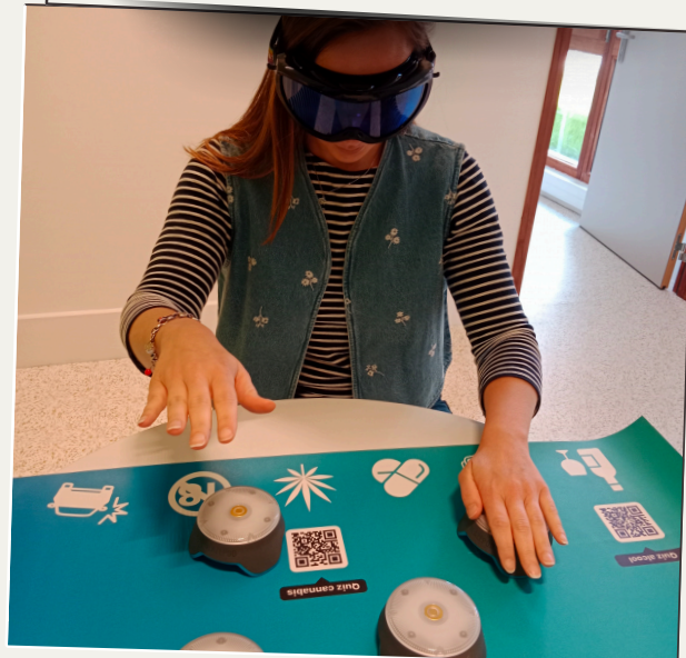
Test de rapidité avec lunettes de simulation