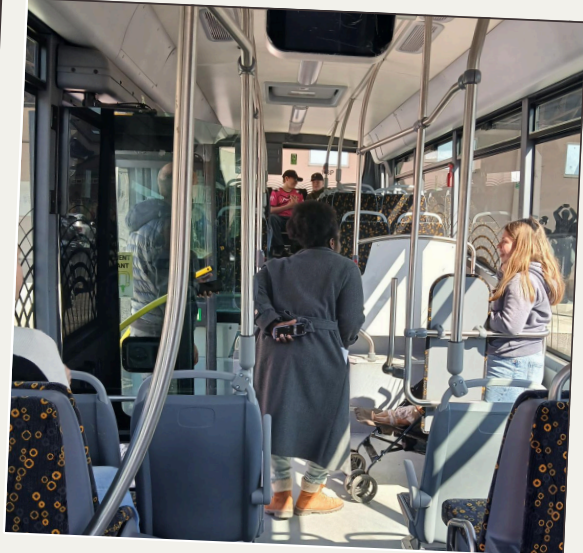
Atelier Trajet sous surveillance