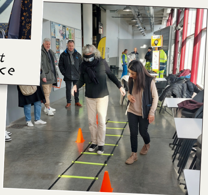
Echelle avec lunettes de simulation