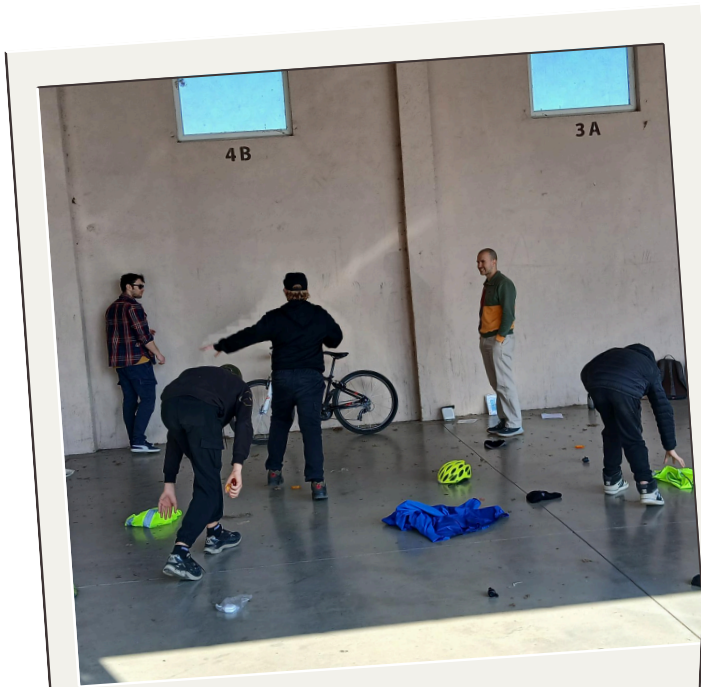
Atelier 1, 2, 3 Vélo !